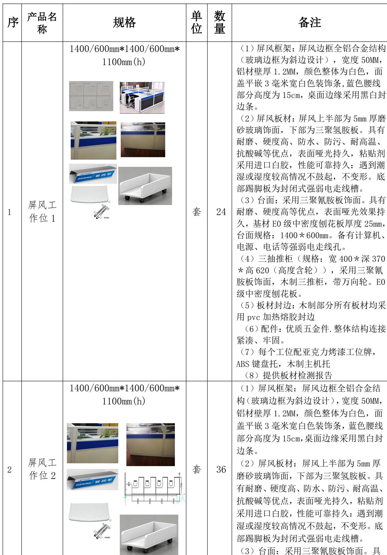
附件：办公工位采购明细表